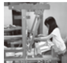
松阪木綿 機織り コースターづくり 600円